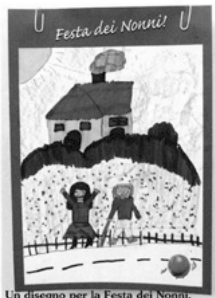
Un disegno per la Festa dei Nonni.

una 'cultura' del rispetto che stimoli i giovani a stringere legami con le generazioni precedenti, favorendo quel processo di transizione dei valori e della memoria che appare sempre più vitale per questa nostra società ...".