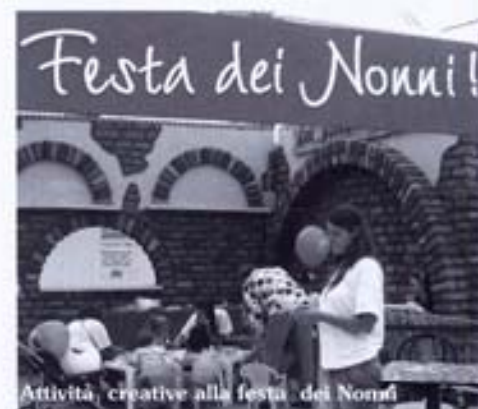
Attività creative alla festa dei Nonni

Così la strofa e ritornello della canzone, composta da Walter Bassani e cantata da Peter Barcella, che il Centro Commerciale Globo di Busnago ha messo su un CD e donato a tutti i nonni in occasione della Festa dei Nonni del 2 Ottobre scorso. L'evento si è aggiunto alla grande iniziativa del Comitato per la Festa dei Nonni che con l'Ufficio Olandese dei Fiori quest'anno ha fatto fiorire la