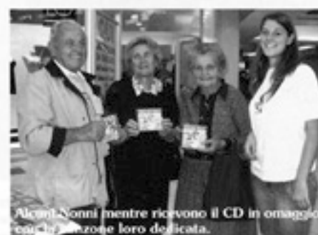
Alcuni Nonni mentre ricevono il CD in omaggio per la canzone loro dedicata.