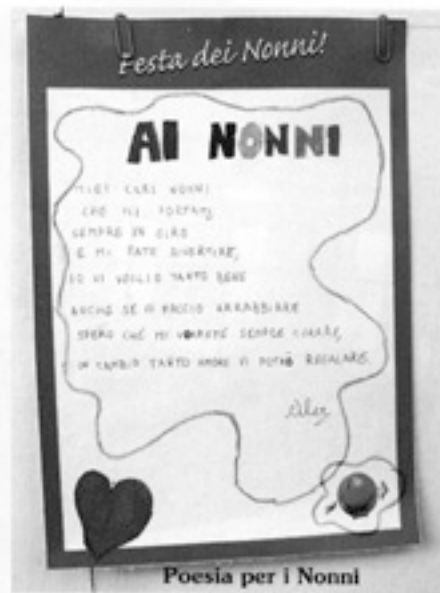
Poesia per i Nonni

hanno creato disegni e poesie sul tema 'Come vedo i miei Nonni'. Tutti i lavoretti dei bambini sono stati messi in mostra durante la Festa dei Nonni.