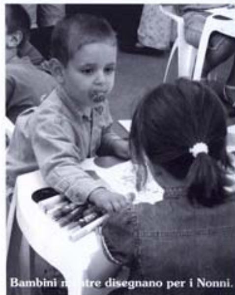
Bambini mentre disegnano per i Nonni.

Poesie, disegni e ... una canzone per la Festa dei Nonni 2006