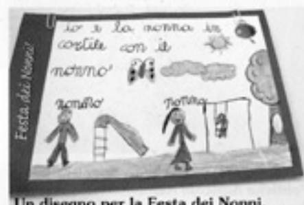
Un disegno per la Festa dei Nonni.

Grande gioia quindi per tantissimi nonni che hanno ricevuto con piacere ed orgoglio il motivo dell'iniziativa: "... dare rilievo ed importanza alla creazione di