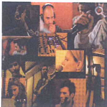
Alcune immagini del progetto